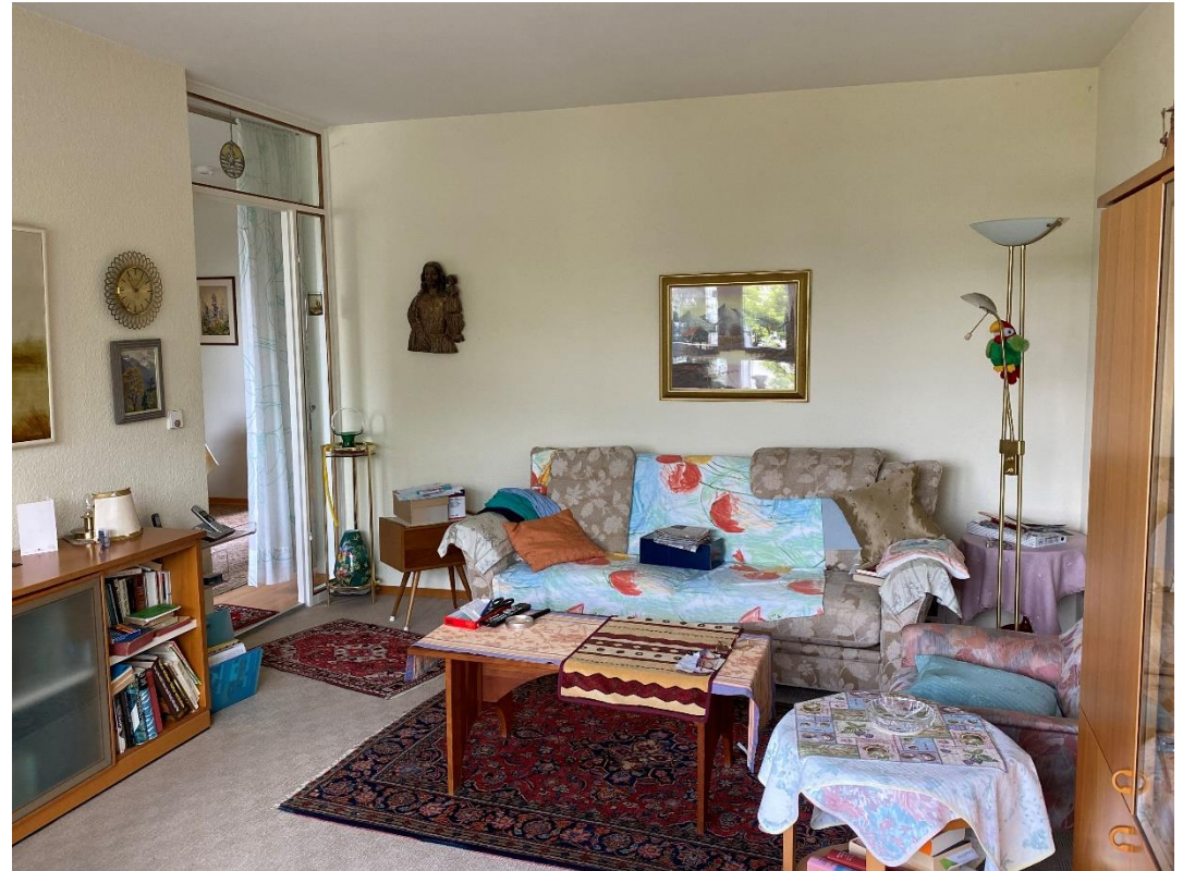
Schlafzimmer und Wohnzimmer