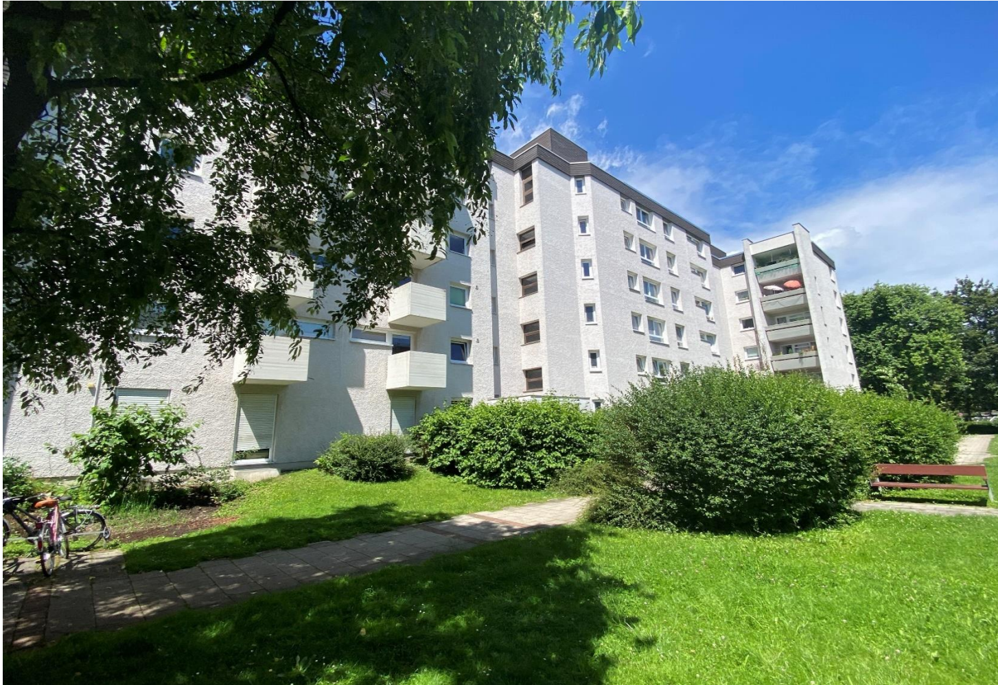
Ostansicht des Gebäudes