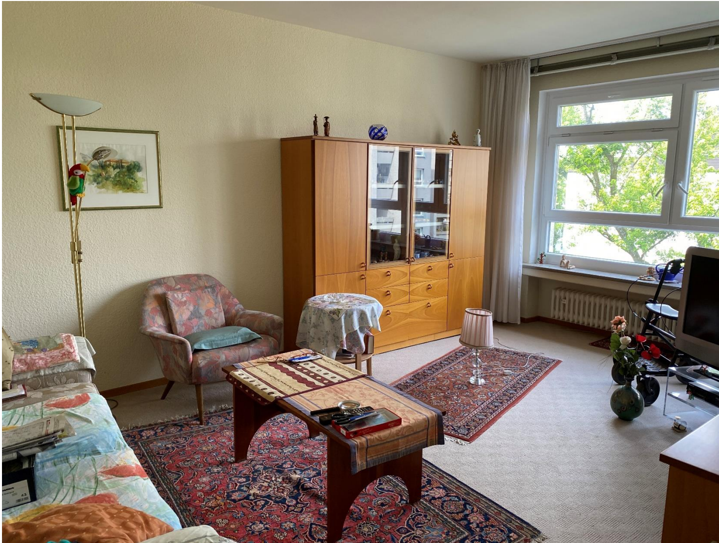
Wohnzimmer mit Westausblick