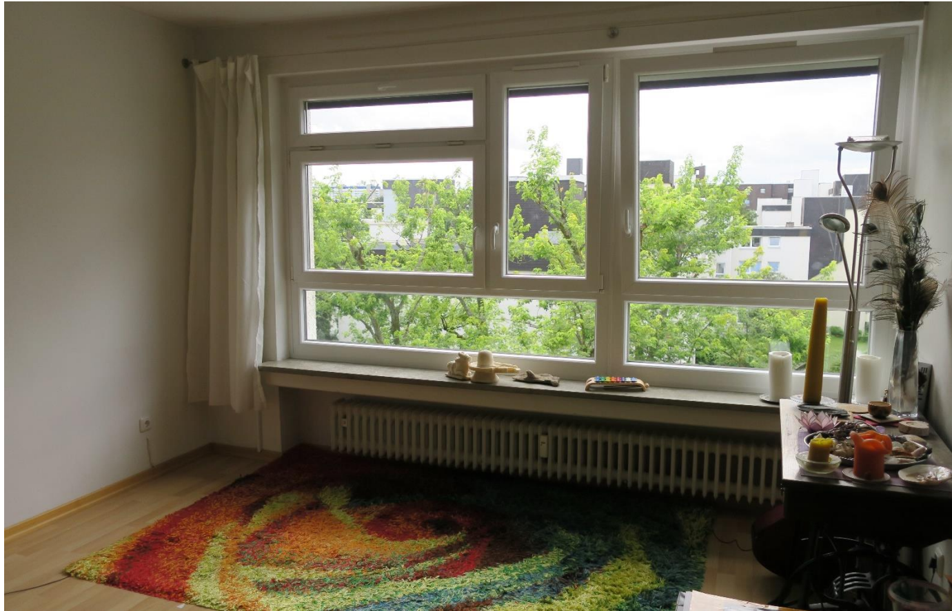
Wohnzimmer mit Westausblick