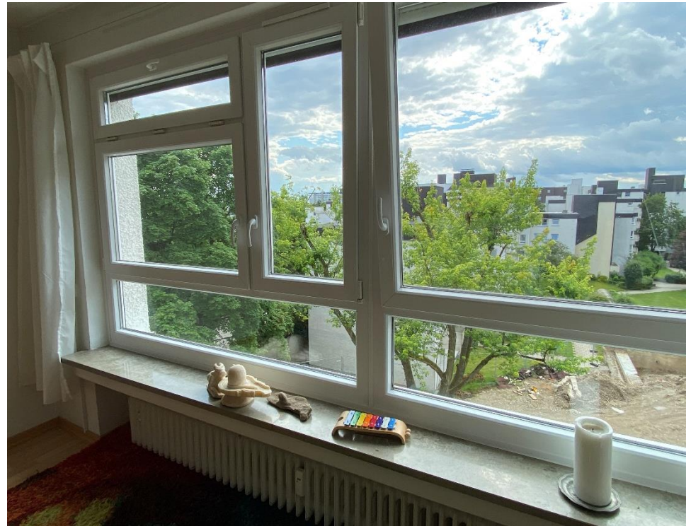
Blick vom Wohnzimmer nach Südwesten